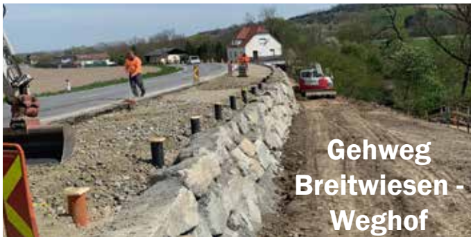
Gehweg Breitwiesen - Weghof