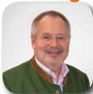
Bürgermeister Franz Kieslinger