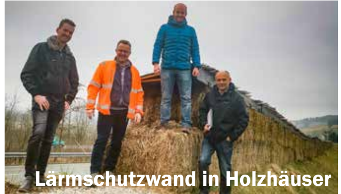
Lärmschutzwand in Holzhäuser