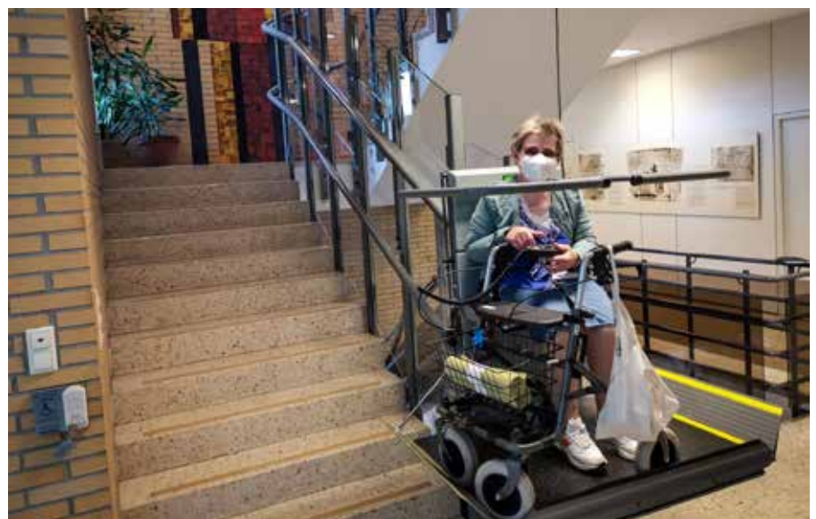
Ab sofort kann der neue behindertgerechte Treppenlift im Amthaus benützt werden