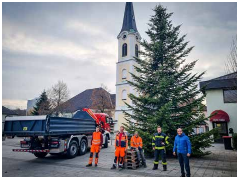
Bgm. Richtsteiger bedankte sich beim Team des Bauhofes für die gute Zusammenarbeit mit Fritz Schlager von der Feuerwehr Wallern/Tr. beim Aufstellen des Weihnachtsbaumes