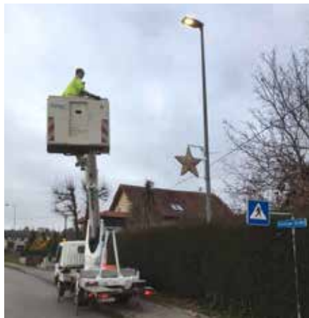
Die neuen Sterne entlang der Grieskirchner Landesstraße sind ein besonderer Hingucker in der vorweihnachtlichen Zeit

Der Ortsbildausschuss hat sich im Jahr 2021 für den Ankauf der neuen Sterne entschieden und wurden diese im heurigen Jahr