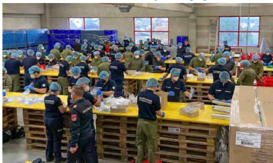
Feuerwehrmitglieder aus fünf verschiedenen Bezirken kommissionieren PCR-Testkits und unterstützen damit die Fa. Spar, bei der die Gurgeltests erhältlich sind