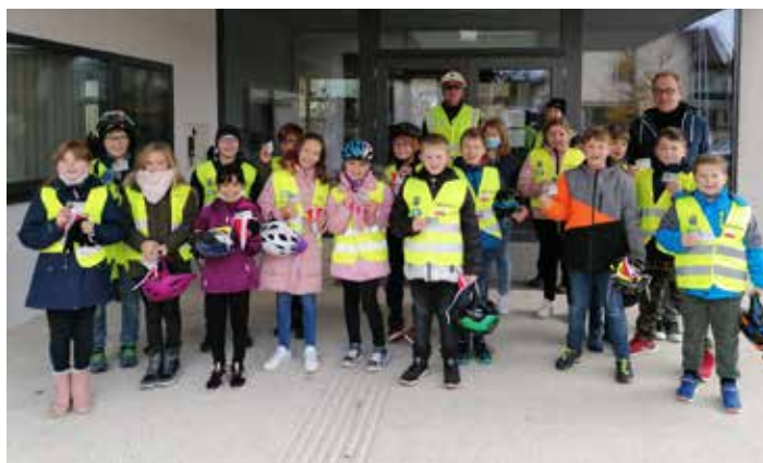
Die stolzen SchülerInnen der beiden 4. Klassen nach der erfolgreich absolvierten praktischen Fahrradprüfung