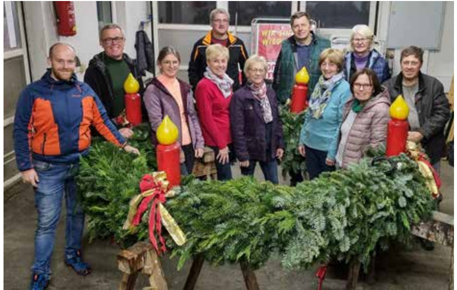
Danke an die Ortsbauernschaft, die auch heuer wieder einen wunderschönen Adventkranz für unseren Marktbrunnen gebunden hat

Auf diesem Wege vielen Dank an alle beteiligten BäuerInnen.