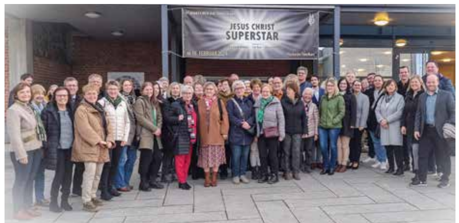
50 WallernerInnen waren von der Kulturfahrt zur Rockoper „Jesus Christ Superstar“ in Timelkam begeistert.