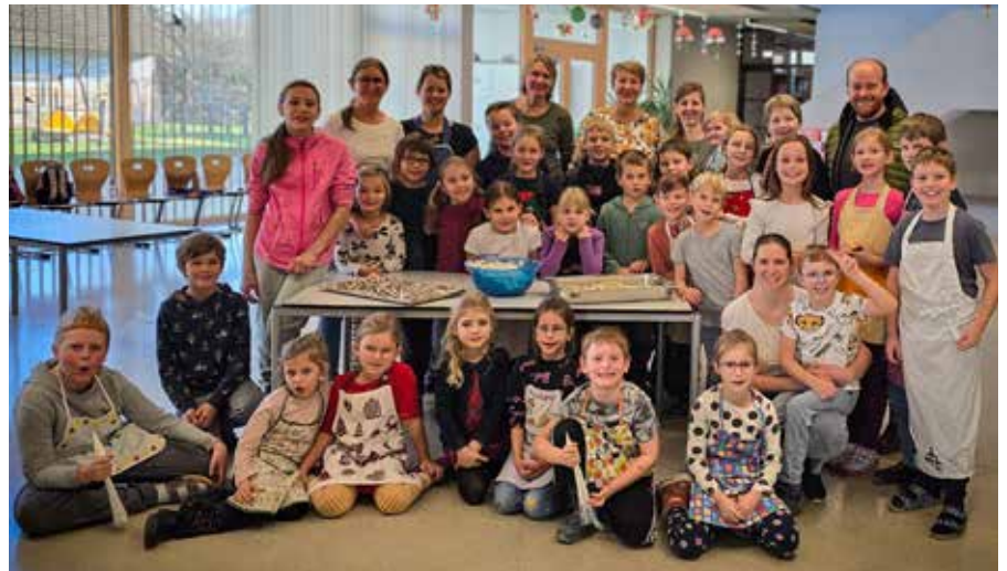
Die eifrigen BäckerInnen und die Helferinnen vom Arbeitskreis der Gesunden Gemeinde präsentierten stolz ihre Weihnachtsnaschereien.