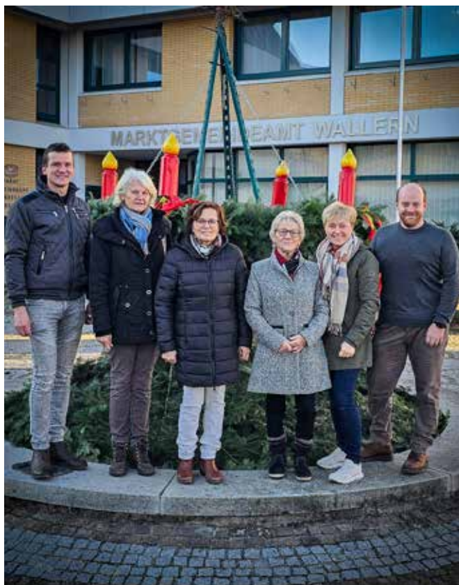
Danke an die Ortsbauernschaft, die auch heuer wieder einen wunderschönen Adventkranz für unseren Marktbrunnen gebunden hat.